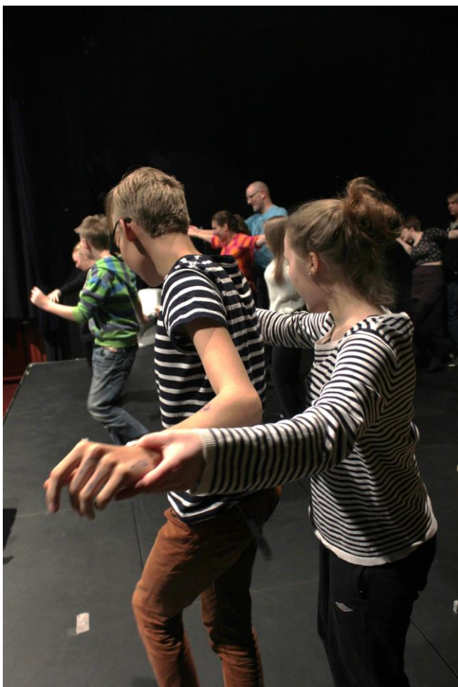
Kuva 2. Koreografiaharjoitus käynnissä

Nuorten kommenteista käy ilmi, että heille on auennut erilaista ymmärrystä elämän haasteista ja että heillä on uudenlaisia keinoja kohdata niitä. Nuorten kirjoittamista avoimista vastauksista voidaan päätellä, että ns. tunnetaidot ovat kehittyneet. Tunnetaidolla tarkoitetaan kykyä havaita ja tunnistaa omia ja toisen tunteita. Tunteiden ilmaisu tapahtuu suhteessa toiseen ihmiseen. Erilaisten tunteiden ilmaiseminen ilmein, elein ja sanoin helpottaa kehoa ja mieltä ja auttaa selviytymään vaikeissa tilanteissa (Suomen Mielenterveysseura, 2014).