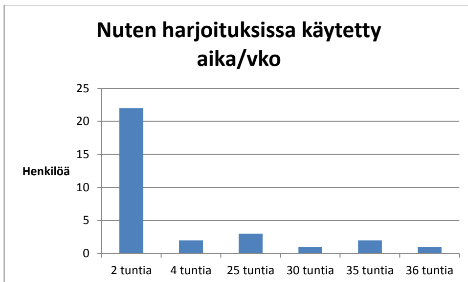
Kuvio 1. Kuinka paljon käytät aikaa (tuntia/viikko) Nuorisoteatterin harjoituksissa

Suurin osa vastaajista ilmoitti käyttävänsä aikaa harjoituksissa kaksi tuntia viikossa (Kuvio 1.). Alle kymmenen vastaajaa ilmoitti käyttävänsä 25-36 tuntia harjoitusai- kaa. Vastausten hajonta selittyy sillä, että kyselyn suorittamisen aikana osa nuorisoteatterilaisista osallistui viikoittaiseen teatterikerhoon ja pienempi osa ryhmästä valmistasi esitykseen tulevaa näytelmää.