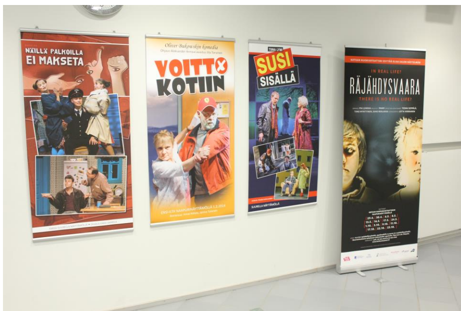
Kuva 1. Räjähdyksivaara Kotkan Kaupunginteatterin ohjelmistossa

Keväällä esityksen näki 1100 katsojaa. Näytelmällä osallistuttiin myös Taiteen Sulattamon Monitaide festivaaleille KOKO -teatterissa. Esitykset jatkuvat syksyn 2014 aikana. (Lunkka, 2014)