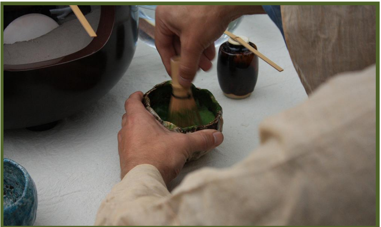
KOLME PIENTÄ PERFORMANSSIA LAMMELLA -TAPAHTUMASTA 20.–22.8.2010